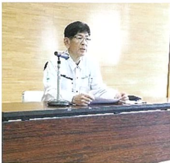
菊次参事による講義

初めに、菊次参事より「事業実施体制の取り組みについて」として、事業を適切に行うガイドラインに沿って、組合の事業実施上必要な現場管理や契約事務の書類管理等について説明を行いました。事業を進める上で法令を遵守し、円滑かつ適切に事業を実施することや、取引先との信頼関係、対等な関係の維持に努めることの重要性等について職員の認識を深めることに努めました。