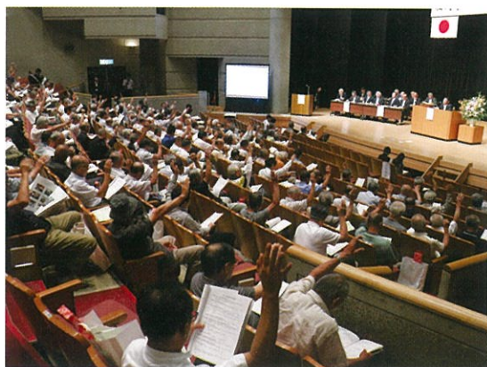
出席された総代の皆様

第10号議案役員選任の件では、現役員におかれましては、本総代会終了により3年の任期満了となります。