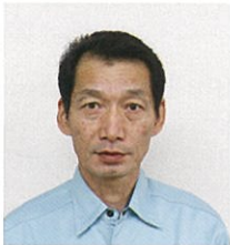
つきじ さんじ ①築地 山治 ②参事 ③組合統括

④豆柴と散歩 毎日朝晩散歩しています。 ⑤座右の銘 親しき仲にも礼儀あり 「信頼」