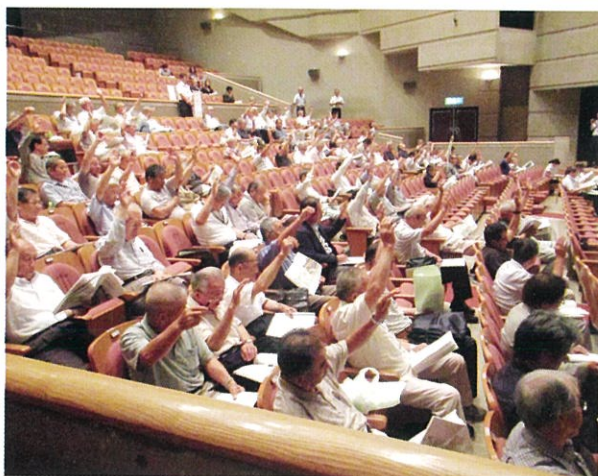
出席された総代の皆様