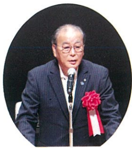
須恵町長 中嶋 裕史 様