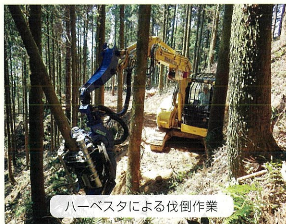
ハーベスタによる伐倒作業